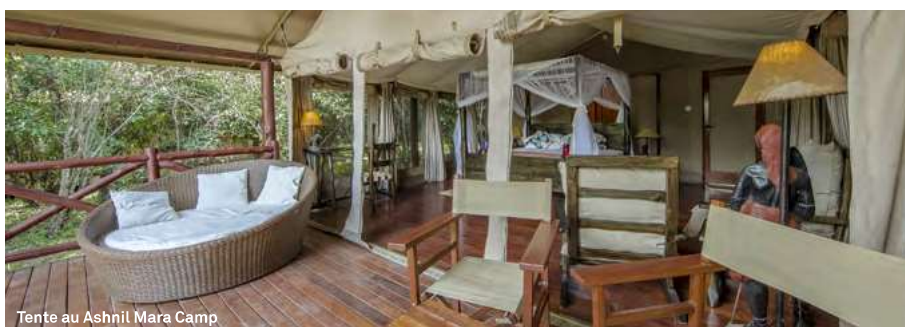
Tente au Ashnil Mara Camp

PRIX BASÉS SUR LE TRANSPORT AÉRIEN EN CLASSE V AVEC KLM